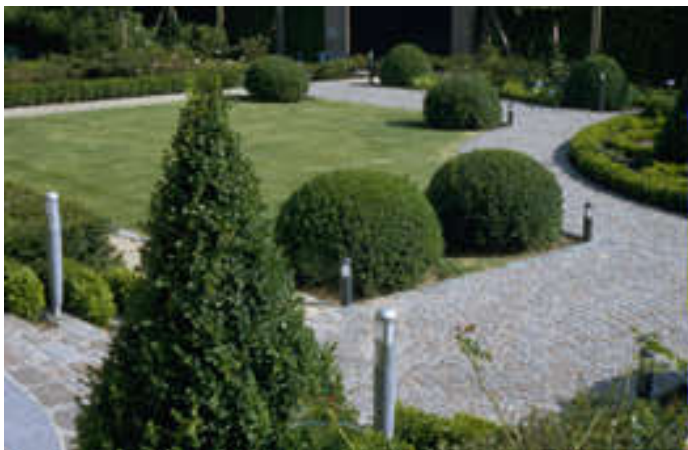
▲ G1. front : stone 3oe + base • rear : small 3oe + anchor (dark grey)