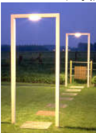
▲ G6. ohu1 + anchor