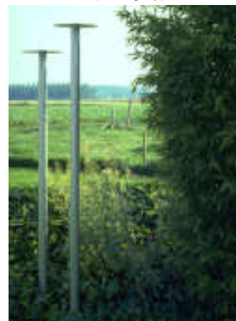
▲ G5. xl3oe & xx3oe + anchor (alum) ▲