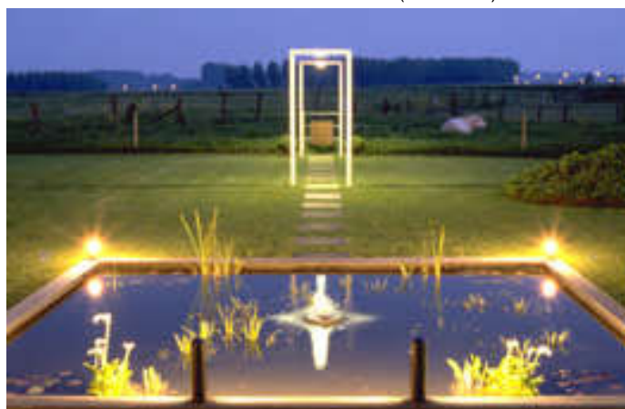
▲ G7. front : small 1t + base in (bronze) • rear : ohu1 + anchor