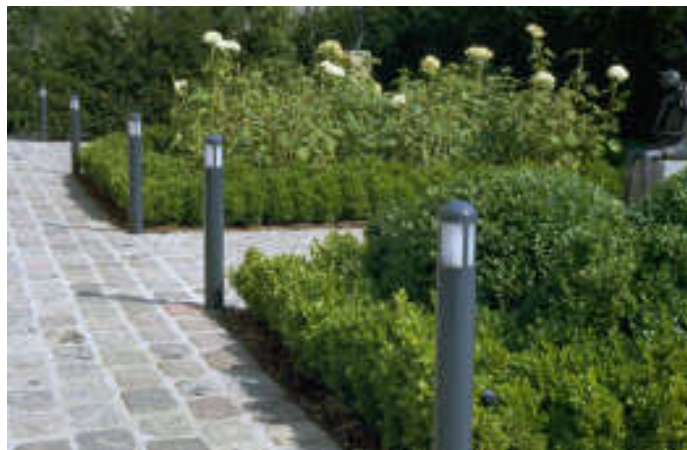
▲ G2. medium 3oe (dark grey) + anchor ▲