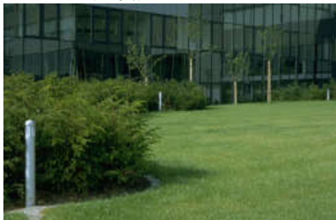
▲ G4. medium 3oe + anchor (aluminium)